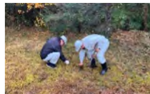
社員による外来草本の駆除

工場内にある湿地の保全を通じて、希少植物であるサギソウの保護に努めています。メリケンカルカヤなどの外来草本を社員が定期的に駆除し、湿地の環境を維持することにより、毎年夏にサギソウが清楚な花を咲かせます。