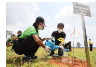
タイでの植林の様子