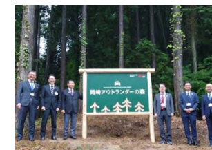
「岡崎アウトランダーの森」(愛知県岡崎市)での看板お披露目式

ミツビシ・モーターズ(タイランド)・カンパニー・リミテッド(MMTh)と非営利団体(NPO)「ミツビシ・モーターズ・タイランド・ファンデーション(MMTF)」は、2021年度より森林再生プロジェクトを開始しました。2022年は「Root for Sustainability」プロジェクトとして、ナコーンラーチャシーマー県で40ライ(6.4ヘクタール)に植林しました。